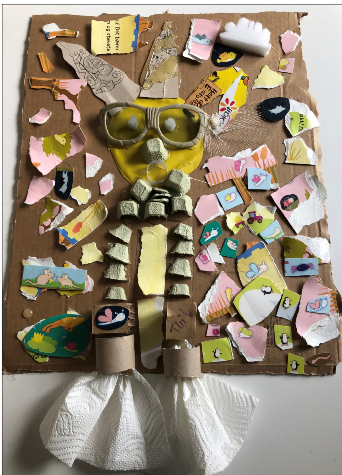
Collage 2020, laget av Tiril 10år

Lærer å blande farger, rengjøre verktøy/ grunnleggende materialkunnskap, primærfarger, ulike penselstrøk/tekstur, lys/skygge, fargekontraster, komposisjon/billedrom, abstraksjon, «se på kunst», eksperimentering/finne eget uttrykk/ fordypning.