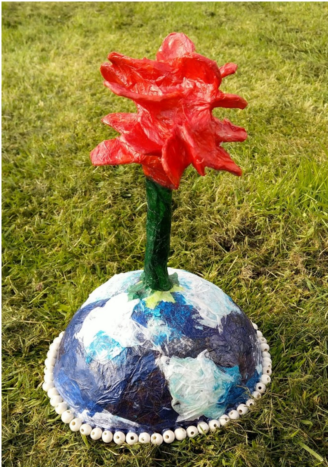
Skulptur, 2020, laget av Adlena 11 år

Utvikle motorikk, bygge, lime, konstruere, modellere, lære grunnleggende materialkunnskap (f.eks. leiras egenskaper), proporsjoner, form: forenkling, volum: konkav og konveks, kontrast, tekstur/overflate, eksperimentering og formutvikling.