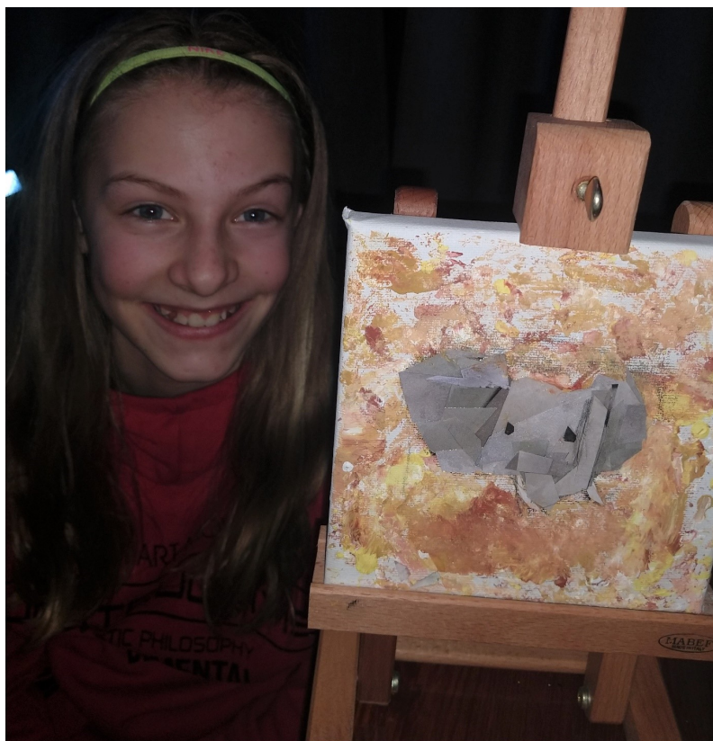
Collage, 2020, laget av Louise 11 år.

Det er ønskelig at elever jobber hjemme mellom hver økt. Det er også viktig at foresatte støtter opp om elevenes interesse for kunst, ved for eksempel å sørge for muligheter til å tegne, male e.l. i hjemmet.