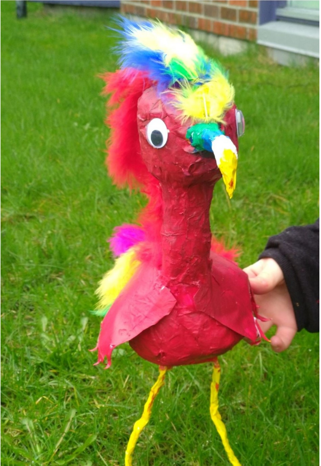
Skulptur 2019, laget av Milena 11 år