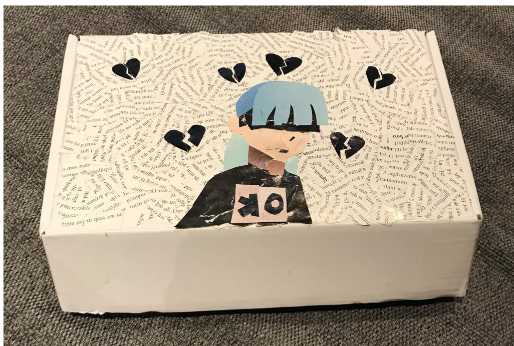
Collage 2020, laget av Malin 11 år