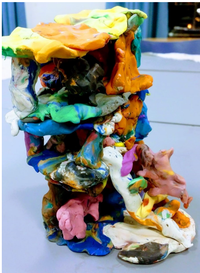
Skulptur «Gris-topia» 2018, laget av Aune 10 år

Elever på billedkunst gleder seg til å ta med sine arbeider hjem. De vil gjerne vise frem, og foreldre vil naturlig nok se. På kulturskolen beholder vi alle arbeider frem til at vi har hatt elev-utstilling. Men eleven på visuell kunst får til slutt ta med alle sine ting hjem!