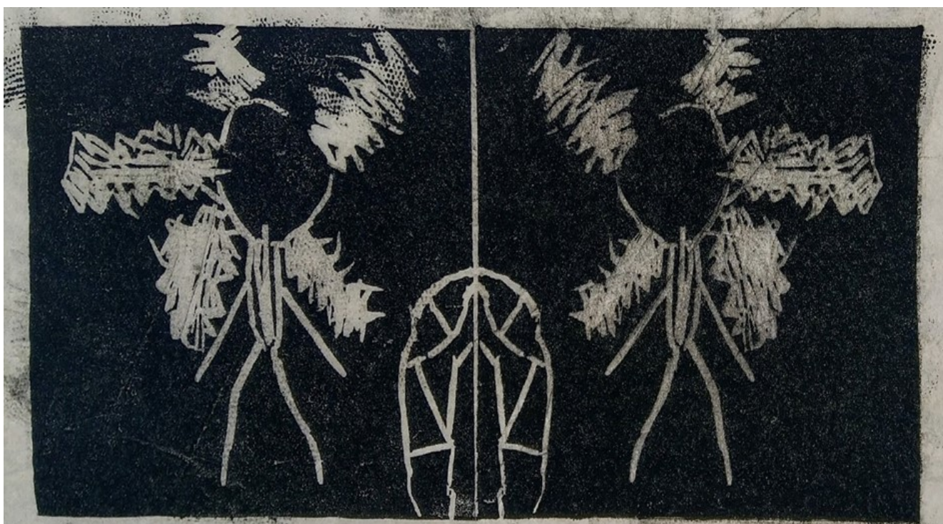
Linosnitt 2019, laget av Janetlyn 10 år.

Elevene får kunstundervisning i eget «kunstrom» på ettermiddager en dag i uken, i grupper på 6-10 elever. En undervisningsøkt varer vanligvis i 90 min. Alder og ferdighet er ofte blandet. For eksempel går oftest elever i 3 - 6. klasse sammen, og elever i 6 - 10. klasse ofte sammen.