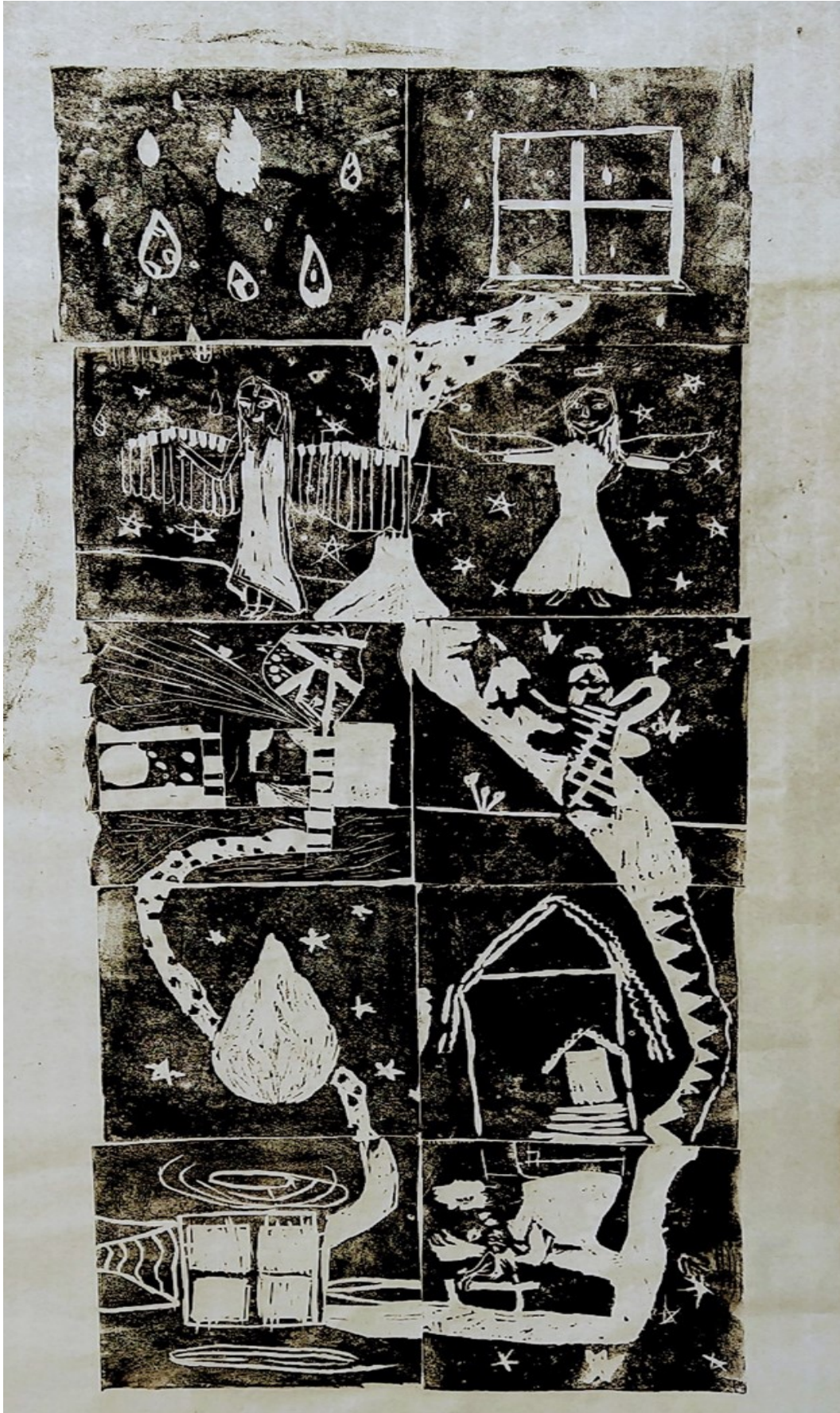
Linocutt 2020, gruppearbeid

Noe viktig eleven lærer på visuell kunst, er å samarbeide med andre. Vi ønsker å skape et godt og trygt miljø for alle våre elever. Små grupper gjør at elevene etter hvert blir godt kjent med hverandre.